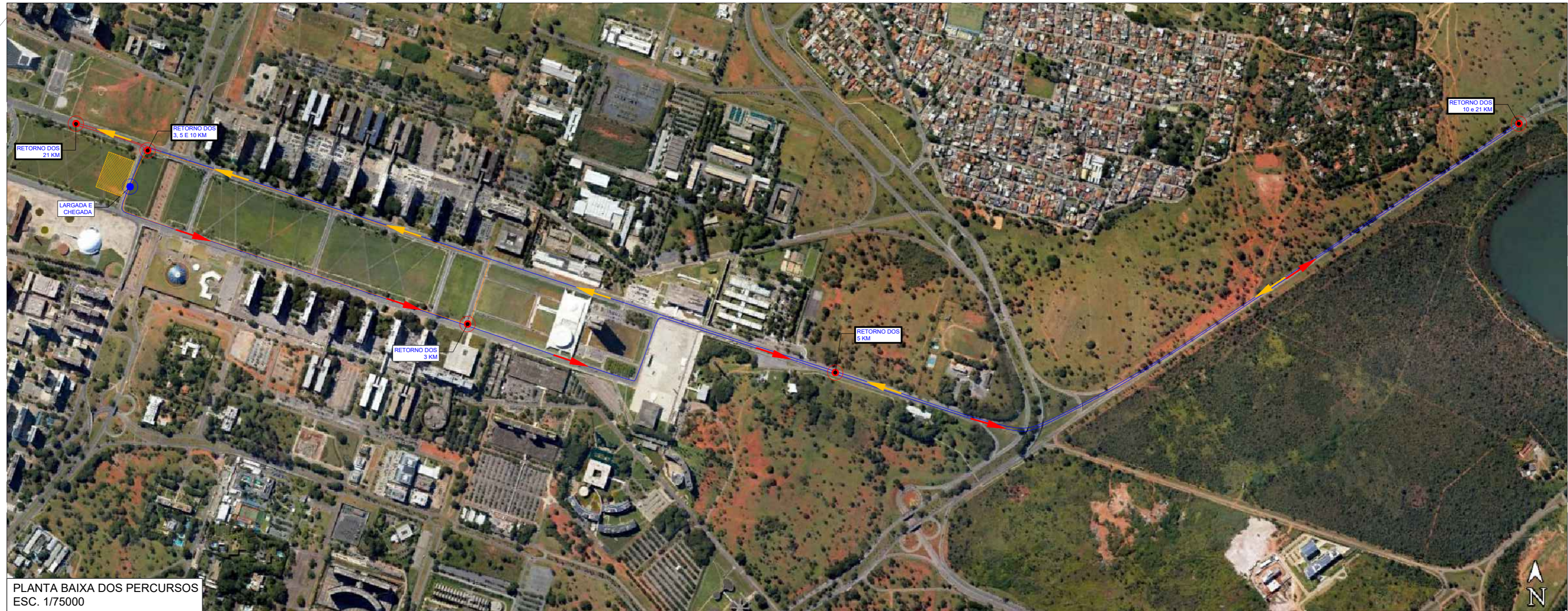
PLANTA BAIXA DOS PERCURSOS ESC. 1/75000