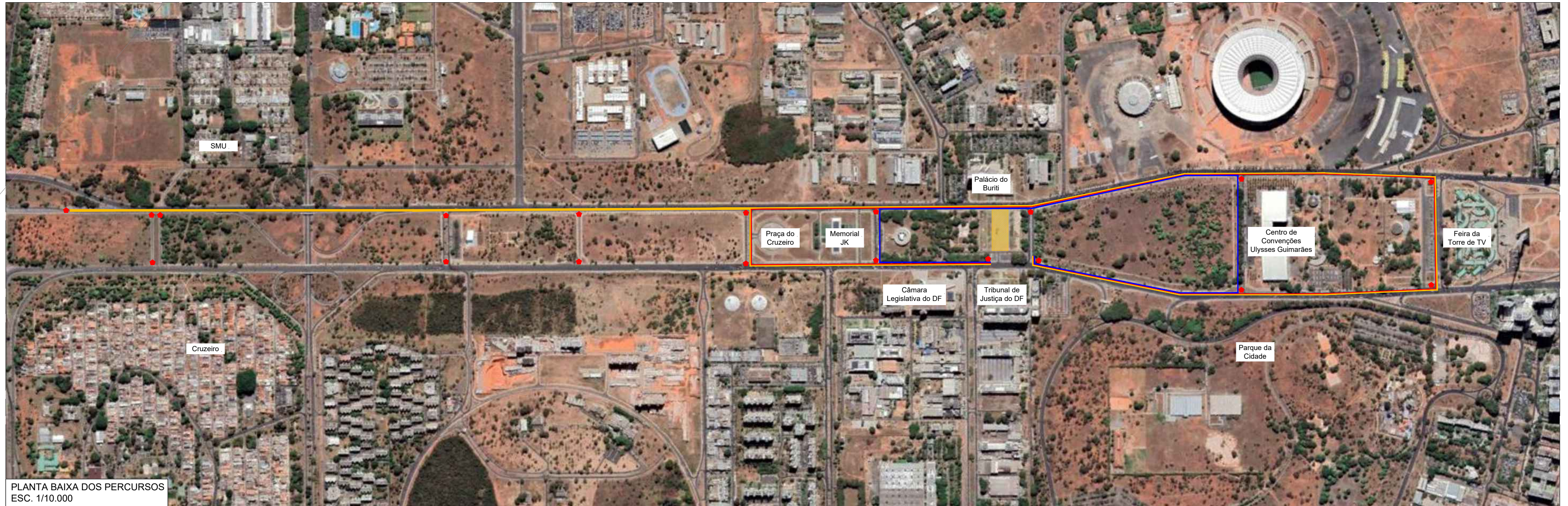
PLANTA BAIXA DOS PERCURSOS ESC. 1/10.000